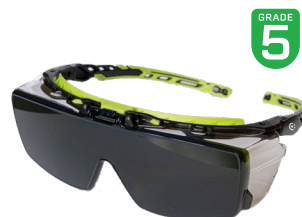
DRIFT 5 grey