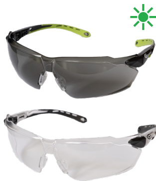
FAST SUN / FAST grey / clear