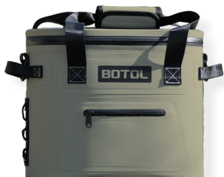
ESCAPE CLASSIC SLFTCLA