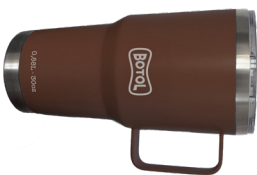
NOMAD CLASSIC SNOMADCLA