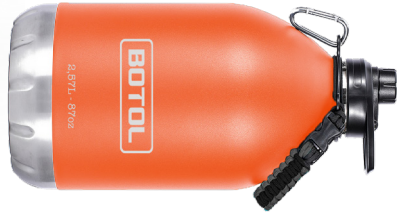
TANK CLASSIC STANKCLA