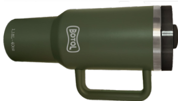
NOMAD MAXI SNOMADMAX