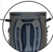
ESCAPE BIG SLFTCLA