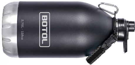
TANK MAXI STANKMAX