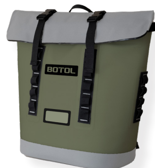
ESCAPE MAXI SLFTCLA