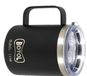
MUG MAXI SMUGMAX