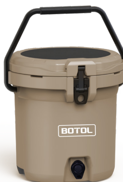
FLOW MAXI SFLWMAX