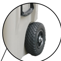
ROVER MAXI SROVMAX