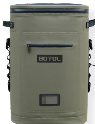
ESCAPE BIG SLFTCLA